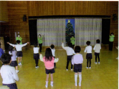
令和7年12月8日(月) 清水南幼稚園