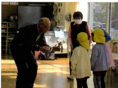
令和7年12月11日(木) ときわ保育所