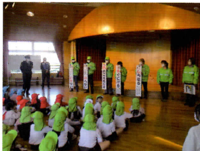
令和7年12月4日(木) 清水北幼稚園