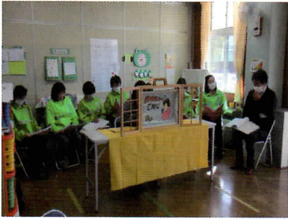
令和7年11月21日(金) 霊山保育園

「やまびこ」とは、沼津警察署地域安全推進員に委嘱されている女性部のことです。管内の保育園・幼稚園・小学校で防犯教室を行ったり、特殊詐欺被害防止を呼び掛ける啓発品の作成を行っています。