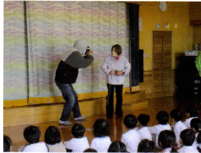
令和7年12月1日(月) 清水町立西幼稚園

11月、12月には防犯教室を8件開催しました。「紙芝居」「クイズ」「いかのおすしダンス」などで【5つのおやくそく】を指導し、子どもたちに【自分の命は自分で守る】をいざという時に実行してもらえるように活動しています。