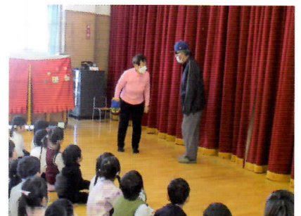
令和7年12月5日(金) 清水幼稚園