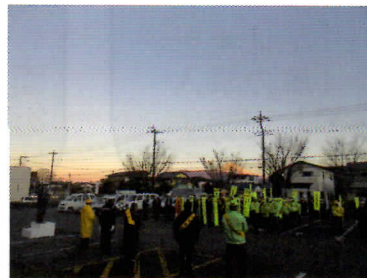
清水町 役場駐車場

12月15日から年末特別警戒を実施しました。15日には市町で年末特別警戒出動式を開催し、特殊詐欺防止のための啓発品を配布をして、年末は特に気を付けるように声掛けをしました。