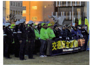
沼津市 北口ロータリー