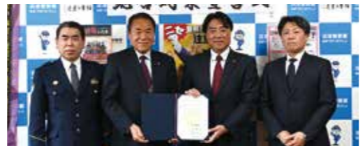
沼津市・清水町・沼津警察署・沼津金融機関防犯協会では、協力してさらなる特殊詐欺被害の防止に努めていきます。