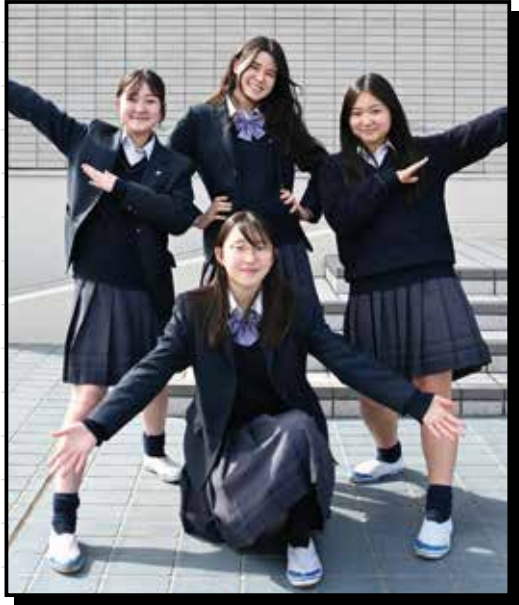
高校生ボランティア団体 沼津ハイポートの皆さん