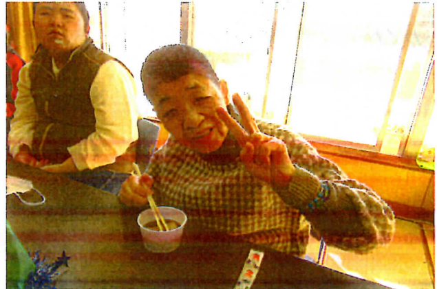
お汁粉を美味しくいただきました！