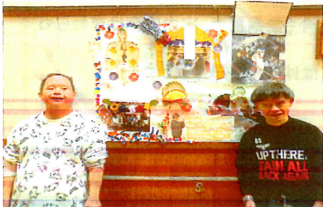
初詣の写真や正月飾りで掲示物を作りました！